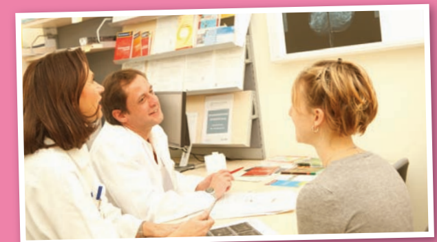
Regelmäßige Vorsorge rettet Leben!

Brustkrebs frühzeitig erkennen und behandeln bedeutet Leben. Wir empfehlen Ihnen daher regelmäßige Mammographie und Sonographie-Kontrollen.